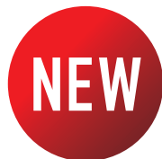
ジョニーウォーカー ブラックラベル 12年

ジョニーウォーカーから、高いデザイン性にあふれ、 若年層が共感できるファッショナブルな限定デザインボトル。